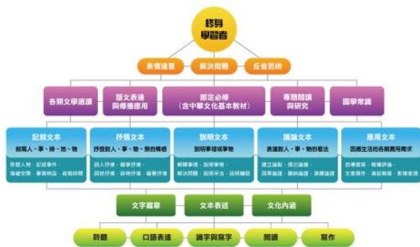
高中國文課程架構圖