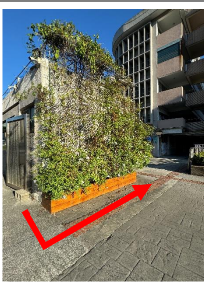
●經過警衛室左轉直行