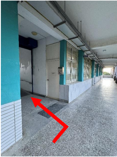
● 經過 218 教室後左轉