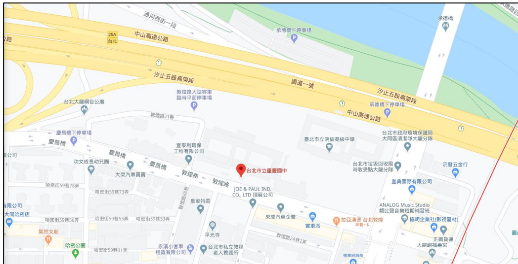
地址：臺北市大同區敦煌路 19 號